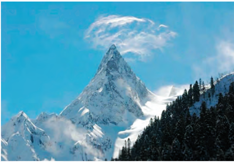
Вершина Белалака зимой

что побежал в Домбай за помощью. Бывалые весело обсуждают создавшуюся обстановку, раздаются смешки. Нам, новичкам, не до смеха. Начал накрапывать дождик. Мы нахохлились. Куда-то исчезла красота. Мрачное место. В таком состоянии мы готовились провести время до утра. Но примерно через час блеснули фары автомашины, и радости нашей не было предела, мы снова в пути, восторгаемся альпинистской выручкой.