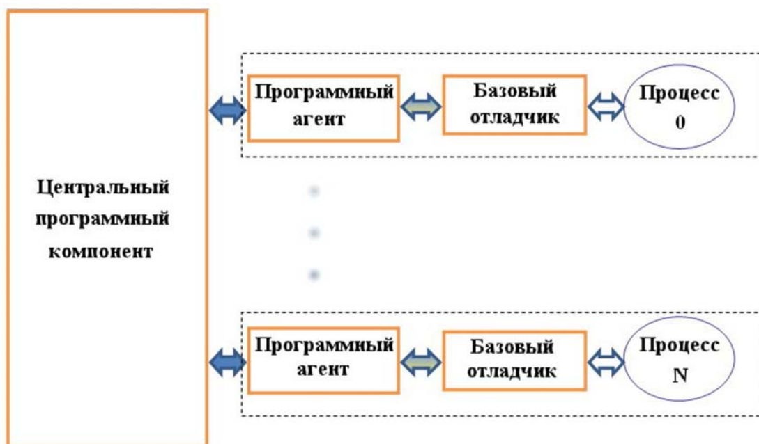
Рис. 1. Компонентная схема отладчика

Программный агент. Этот компонент является промежуточным звеном между центральным программным компонентом и базовым от-