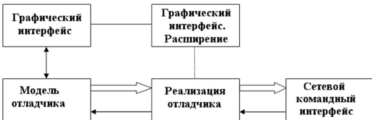
Рис. 3. Архитектура центрального компонента отладчика: \Rightarrow — внутренние команды; \leftarrow — асинхронные сообщения

В процессе отладки программы модули центрального компонента отладчика осуществляют манипуляции с отлаживаемыми процессами — это изменение их состояния (пуск/стоп), чтение/изменение значений переменных и др. Для выполнения таких операций используется собственный программный интерфейс. Командами данного интерфейса являются Java-объекты, которые передаются по сети посредством TCP-протокола. Для передачи команды по сети она предварительно преобразуется в поток байтов и заклочается в конверт , заголовком которого является битовая строка. Номер разряда строки соответствует номеру процесса параллельной программы. Таким образом, установкой необходимых разрядов строки осуществляется обращение к определенному множеству отлаживаемых процессов.