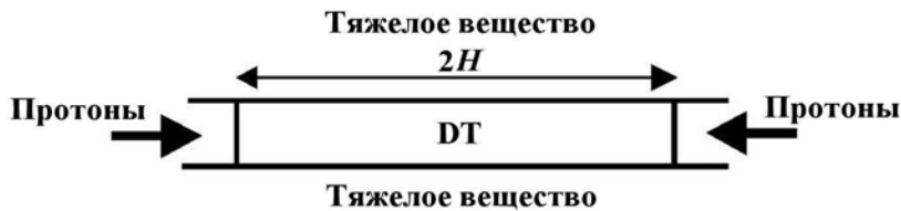
Рис. 1. Схема мишени

сильных магнитных полей является значительное уменьшение теплового потока между оболочкой и горючим [10].