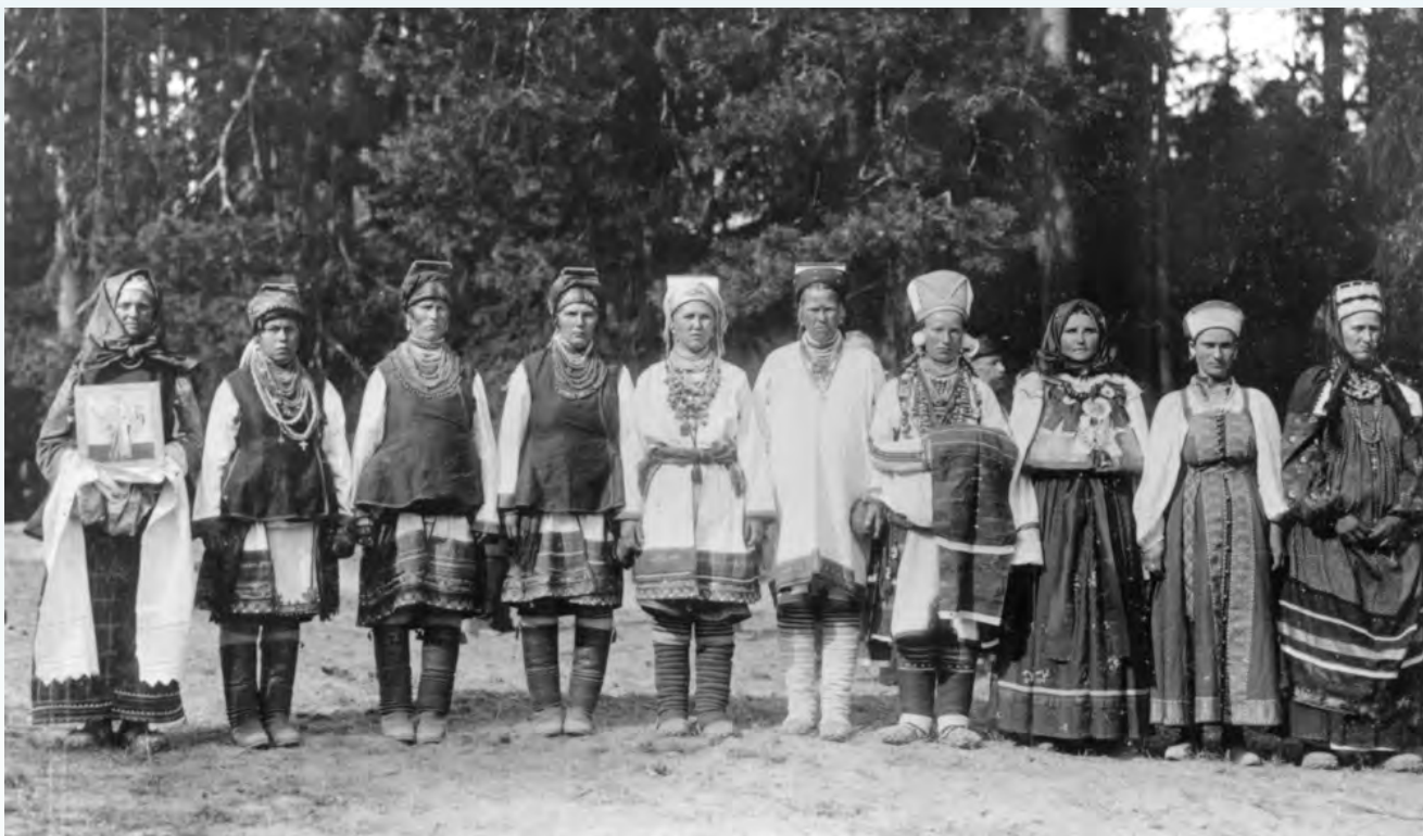
Делегация мордовских крестьян

выходил на перрон, ему устраивались встречи с речами и хлебом-солью. Наконец, 17 июля в 11 утра царский состав подошел к станции Арзамас. Там была сооружена специальная платформа с павильоном, украшенным пальмами в кадках, зеленью и цветами. Царя торжественно приветствовали нижегородский губернатор Унтербергер, представители различных сословий Нижегородской губернии. Здесь же к императору присоединились министр внутренних дел Плеве и министр путей сообщения Хилков.