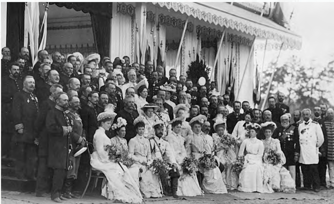
Царская семья с дворянами Нижегородской губернии

Церемониал торжественного открытия святых мощей преподобного отца Серафима, Са-