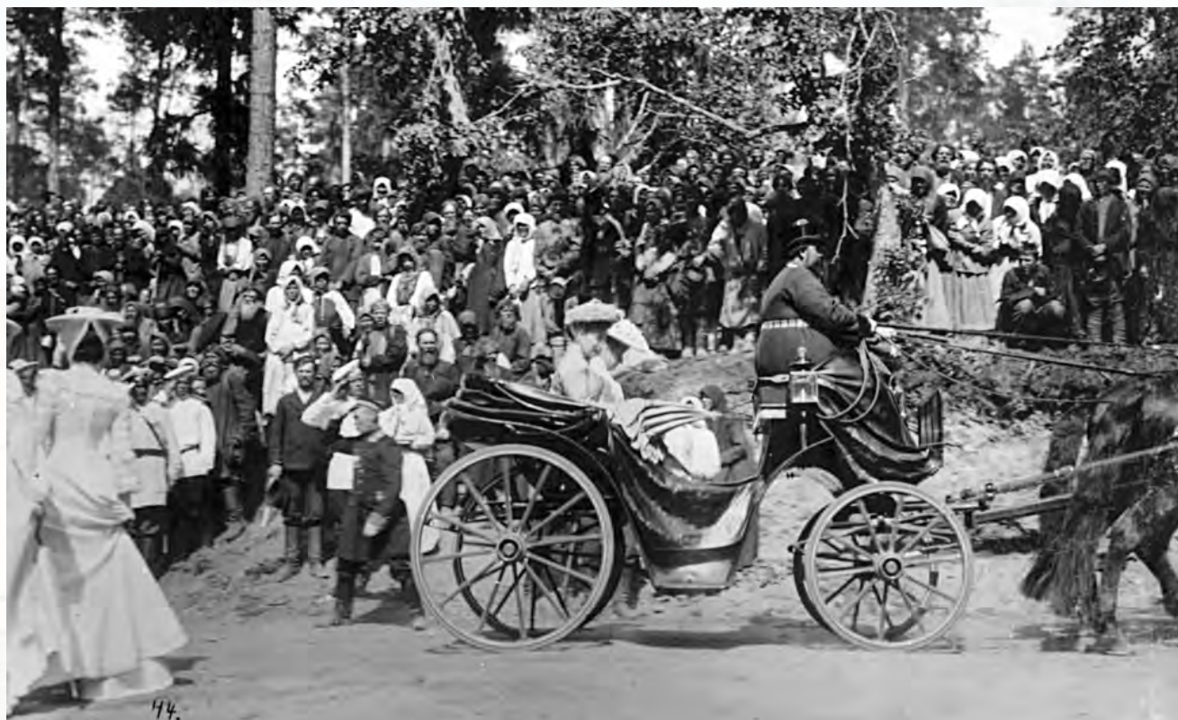
Императрица Александра Федоровна с сестрой вел. кн. Елизаветой Федоровной направляются к источнику прп. Серафима