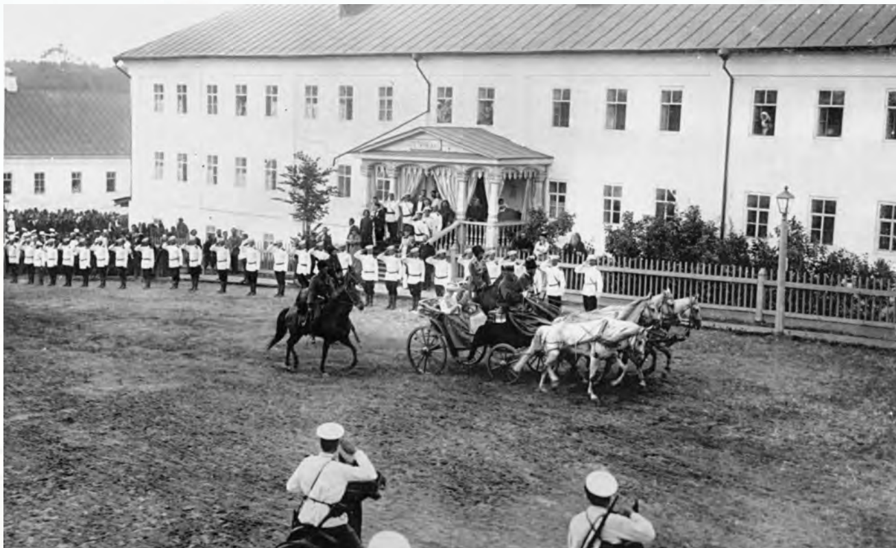
Въезд императорской четы в Саровский монастырь

Как писал Николай II в своем дневнике, «...ехали хорошо и не торопясь». По пути было несколько остановок. В Коломне и Рязани царь