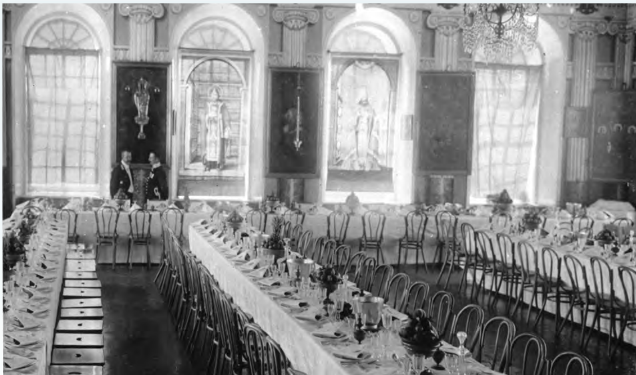
Праздничная трапеза для гостей