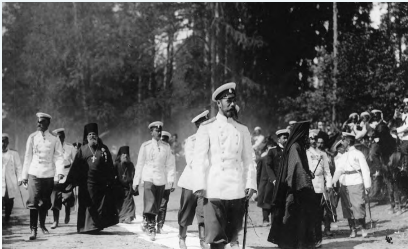
Государь Николай Александрович с членами августейшей семьи направляются к источнику прп. Серафима. Справа от государя — архим. Серафим (Чичагов)