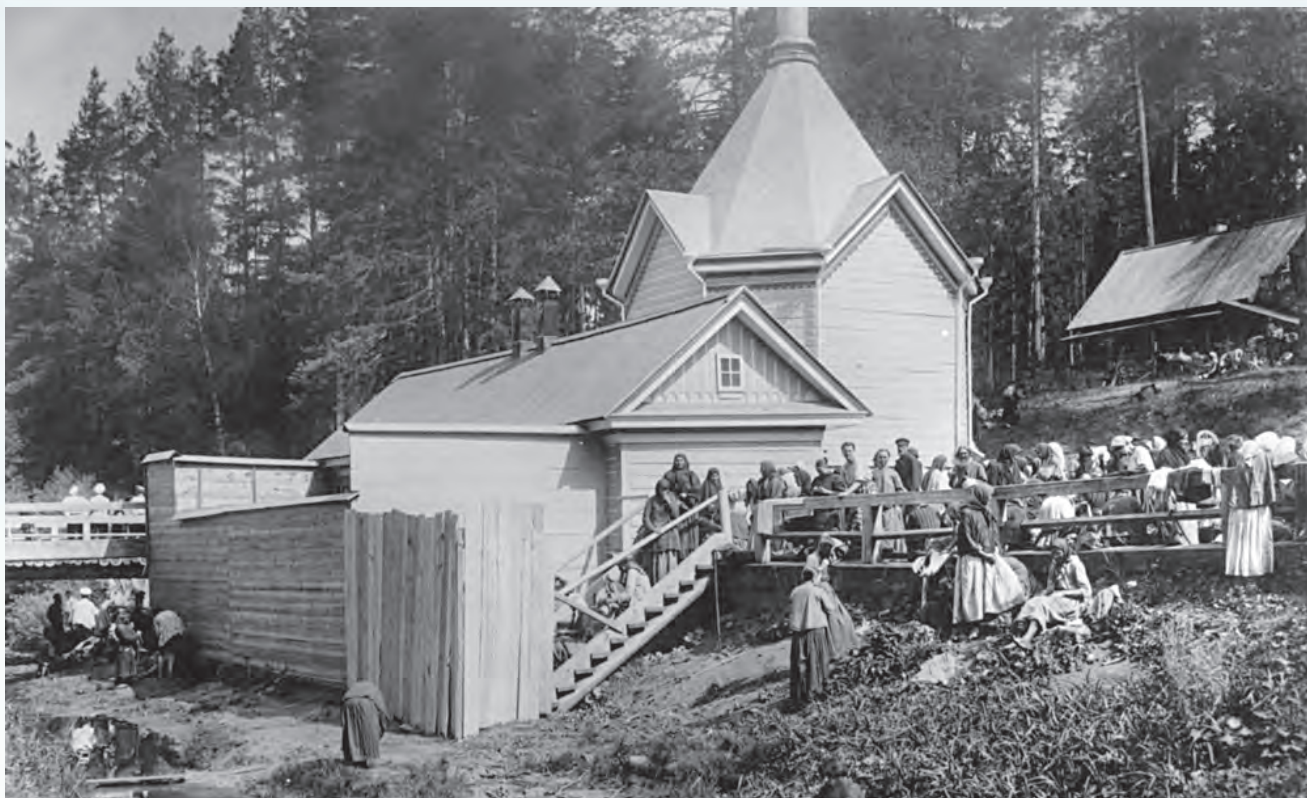
Часовня с купальнями над источником прп. Серафима

искажился самый вид этой местности, на который преподобный постоянно смотрел!».