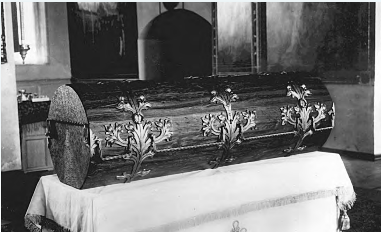
Рака, в которую были помещены мощи прп. Серафима, изготовленная по типу старого гроба-колоды, в Зосимо-Савватиевской церкви

бора, после чего мощи были помещены в установленную в соборе раку.