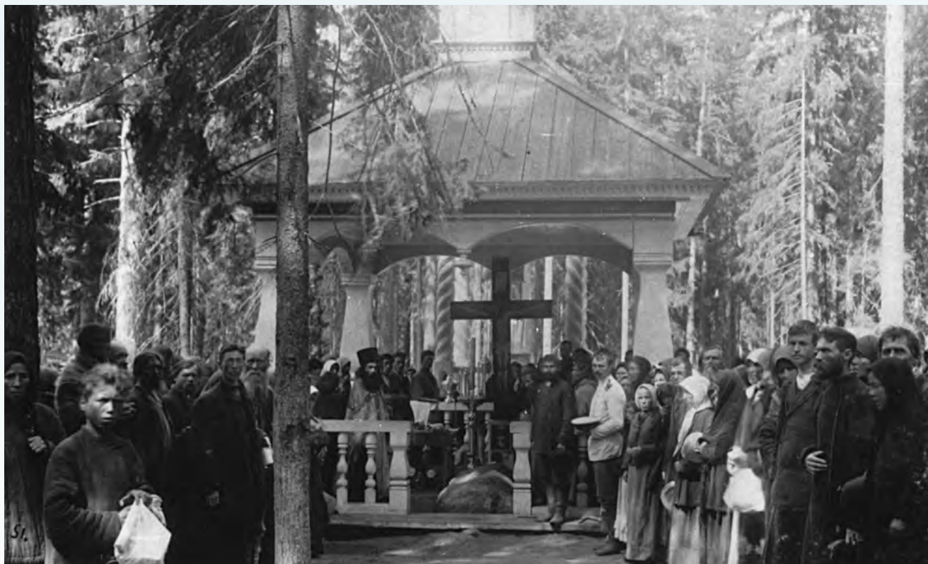
Часовня над камнем, на котором молился прп. Серафим 1000 дней и ночей