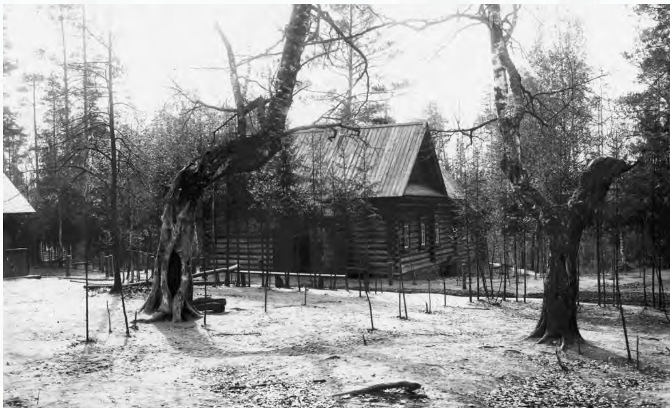
Пустынька прп. Серафима