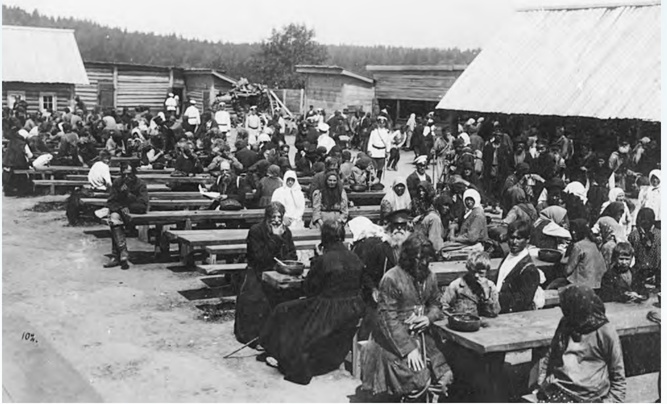
В полевой столовой для паломников

уменьшения провозной платы – это конкуренция», – считал один из организаторов торжеств архимандрит Серафим (Чичагов).