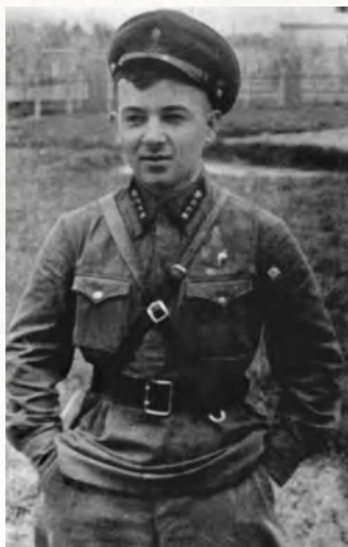
На подмосковном полигоне. 1942 г.

Фронт приближался, и было решено эвакуировать сотрудников полигона на Урал. Так он впервые оказался на Урале, в деревне Непряхино Чебаркульского района Челябинской об-