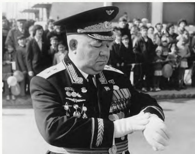
Парад в честь 40-летия Победы. Снежинск. 1985 г.