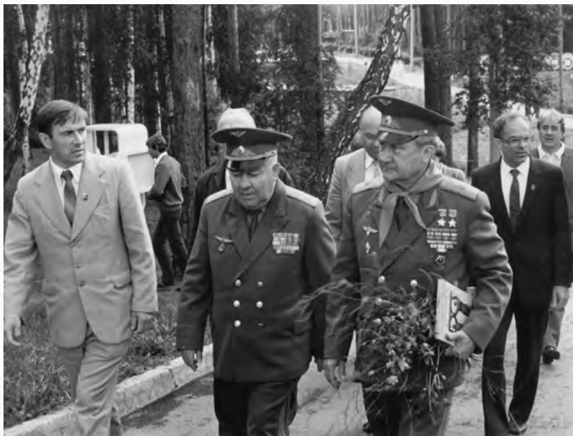
Е. А. Дедов, Г. П. Ломинский, космонавт А. В. Филипченко. 1983 г.

Когда в городе освободилось несколько зданий воинской части, они были переделаны в городскую поликлинику и стоматологию.