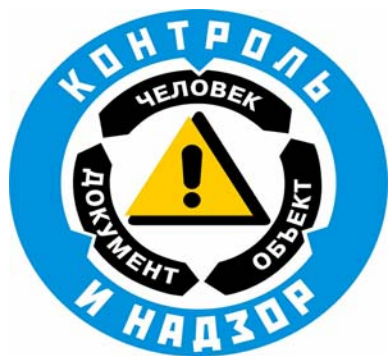
Рис. 2. Концепция безопасности ФГУП «РФЯЦ-ВНИИЭФ»

Сама концепция звучит так: «Абсолютной безопасности нет. Безопасность выполнения любого вида работ может быть обеспечена на приемлемом уровне, если будут устойчиво и надежно функционировать четыре основных компонента: человек, документ, объект, контроль и надзор».