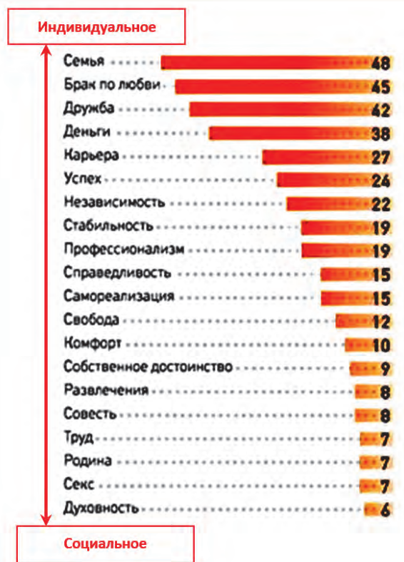
Приоритеты молодых («Z-поколение», 2005–2025 гг.)

Y-поколение (а это – современные молодые люди и специалисты предприятий) существенно отличается от поколений ветеранов и опытных специалистов, на которых собственно и ориентирована и опирается классическая система организации производства, в том числе и принятая в атомной отрасли система безопасности. А вот так (см. рис.), по данным социальных исследований, выглядят приоритеты молодежи («Z-поколение» (2005–2025 гг.): они отходят еще дальше от традиционных ценностей, а ведь в очень скором времени – это наши будущие молодые специалисты.