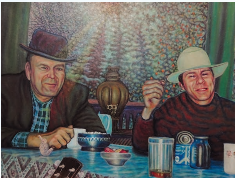
«О чем может думать настоящий мужчина? О новом саде, о новом доме, о новых детях», 2019

Как говорил Ч. Чаплин: «Художники больше философствуют, чем рисуют картины». Вот и мне представляется, что функция мужчины в природе Космоса состоит в постоянном продолжении через женщину, себя и своего рода, в развитии своей материальной и духовной сущности на пути к его Создателю. «Он создал нас для Себя, и трепещет сердце наше, доколе не успокоится в Нем», – так сказал великий и блаженный Августин. И в этом послании для человечества изречено все на тысячи и многие миллионы лет вперед. Человек, как и все разумные «твари» Вселенной, должен в итоге прийти к своему Прародителю, к Первопричине мироздания, к Богу. И, может быть, даже заменить его... Ведь Он – живой и любит нас, и, как мать жертвует собой, давая жизнь своему ребенку, Он создал нас,