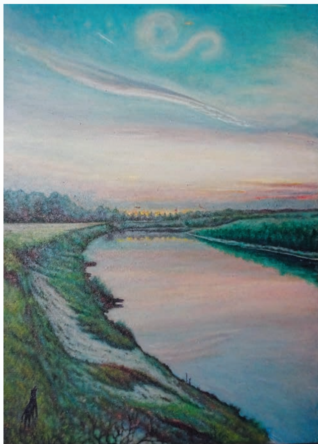
«Почему волки не лают», 2017

В 2018 г. моя работа под названием «Если бы молодость знала, если бы старость...» уже выставлялась в залах картинной галереи г. Сарова. Ее недосказанное название предполагало, казалось бы, известное окончание: «... – если бы старость могла». Но так ли это выглядело в представлявшейся картине и в сегодняшней жизни на самом деле? В своих работах я всегда старался одновременно поднять и закулисный смысл изображаемого, подобно всякому многогранному объекту, для объема которого не хватает тени. Вот и в этой картине пожилой мужчина в потертом пиджаке сидит на веранде своего старого дома и вспоминает прошлое... О том, как он посадил первое дерево, как построил первый дом, как стал отцом, дедом... В общем, состоялся как мужчина. Что еще нужно для него и таких, как он?! Рядом сидит его сын, умный и сильный, который говорит, что тоже посадит сад и с не простыми, а с райскими плодами,