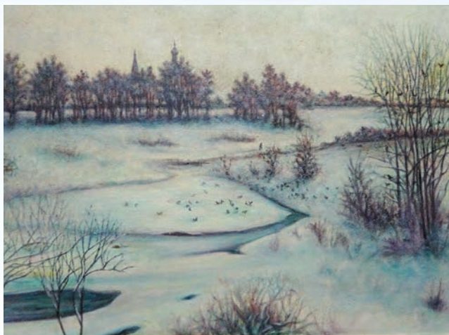
«Вот моя деревня», 2010

чами, опустившимися на нашу многострадальную землю после того, когда со всех сторон ее окружили вражьи силы. И лишь святой дух россиян (в углу работы) продолжал противостоять злу.