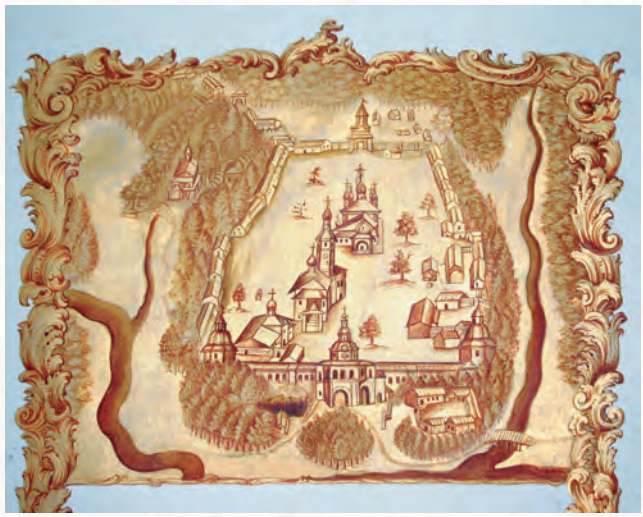
Рисунок иеромонаха Иоакима, послуживший первоосновой литографии «Вид Саровской пустыни», 1760-е г.

Великий подвижник умер, но не умерла память народа, не умерла вера в силу его молитв и покровительство всем страждущим помощи. Из уст в уста передавались богомольцами рассказы о чудотворениях, происходивших на намолен-