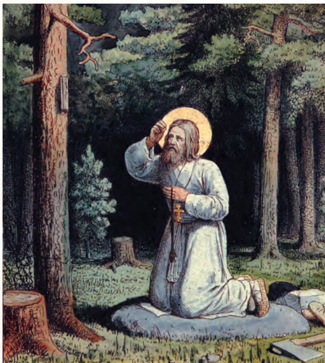
Моление прп. Серафима на камне. Литография

Но самым известным и неоспоримым чудом является рождение 30 июля 1904 г. в царской семье наследника цесаревича Алексея. Не зря Господь не давал императорской чете мальчика – Александра Федоровна являлась носителем страшного и неизведанного в те годы заболевания гемофилии. Одна за другой родились четыре дочери: Ольга (3 ноября 1895 г.), Татьяна (29 мая 1897 г.), Мария (14 июня 1899 г.) и