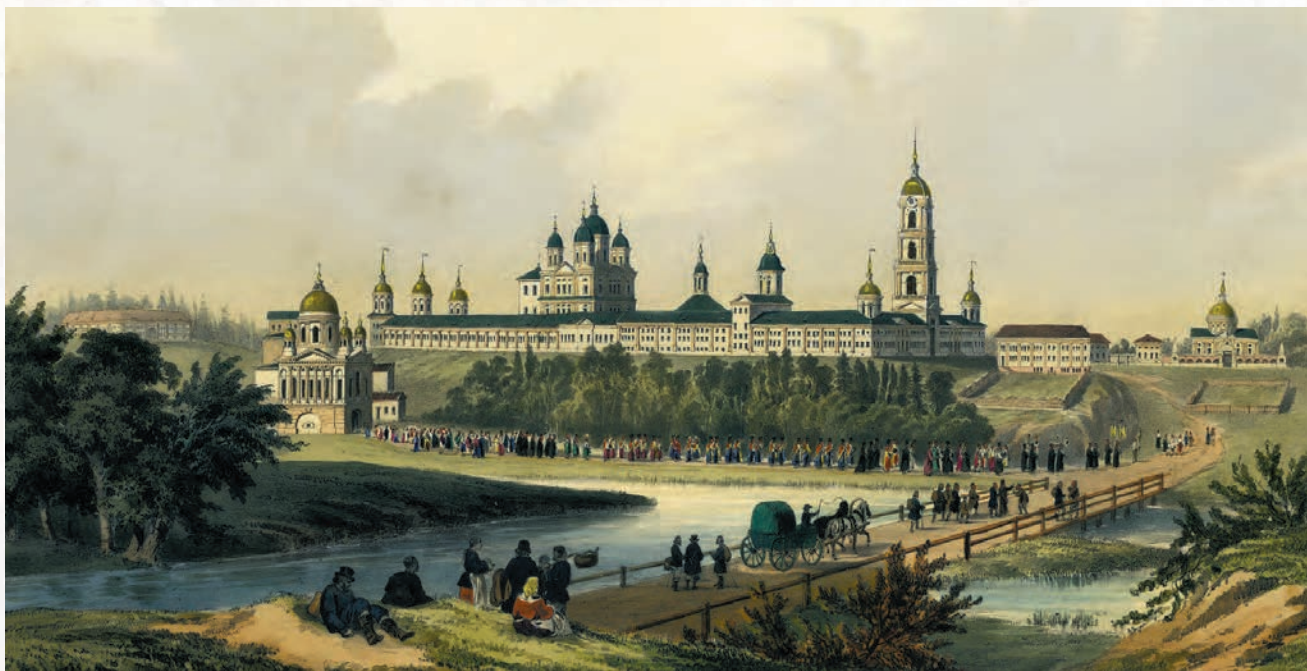
Саровский монастырь. Литография середины XIX в.

скую площадь. «Он был роста высокого, около двух аршин и восьми вершков [около 180 см. – В.С.]... Лицо у него полное, покрытое приятной белизной, нос прямой и острый, глаза светло-голубые, выразительные и пронизательные, брови густые, волосы на голове светло-русые и также густые. Лицо его окаймлялось густою окладистою бородою, с которою на оконечностях уст, или рта, соединялись длинные, густые же усы», – таково было описание внешнего вида Прохора, составленного саровскими монахами.