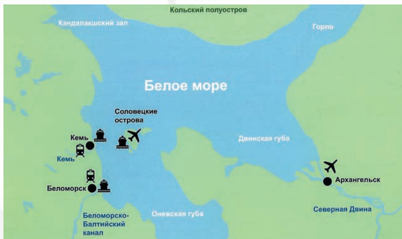
Белое море. Соловецкие острова

ский (Нижегородский), Татарский (Республика Татарстан), Куйбышевский (Самарский), Сталинградский (Волгоградский) и Саратовский областные комитеты ВЛКСМ отобрать к 1 июля 1942 г. в школу юнг Военно-морского флота по 500 мальчишек, исключительно добровольцев, в возрасте 15–16 лет, физически здоровых, с образованием 6–7 классов (комсомольцев и не комсомольцев).