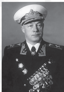
Н. Г. Кузнецов

С началом Великой Отечественной войны тысячи мальчишек-патриотов бежали на фронты и флота защищать Советскую Родину от немецко-фашистских захватчиков. Основную массу юных добровольцев возвращали по домам, но поток их не иссякал. Для упорядочения этого процесса в Военно-морском флоте по инициативе и решением народного комиссара ВМФ Союза ССР адмирала Николая Герасимовича Кузнецова, по согласованию с бюро Центрального комитета ВЛКСМ, в 1942 г. была создана легендарная