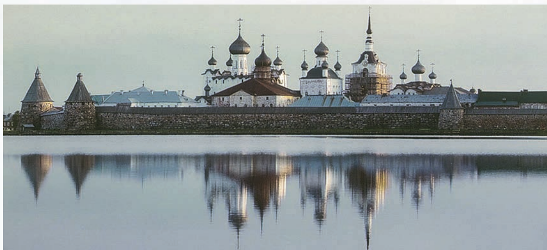
Соловецкий монастырь. Кремль

Учебный план юнг был рассчитан на год и включал следующие предметы: специальность, общевоинская подготовка, военно-морское дело, общеобразовательные предметы (русский язык, математика, физика, география, черчение), политическая подготовка. Все юнги кроме изучения общеобразовательных предметов и теоретической подготовки по флотской специальности проходили морскую практику: учились плаванию и спасению утопающих, оказанию первой медицинской помощи, выходили в море на шлюпках на веслах и под парусом. Такие выходы пользовались у юнг большой популярностью. Юнги полностью обслуживали себя.