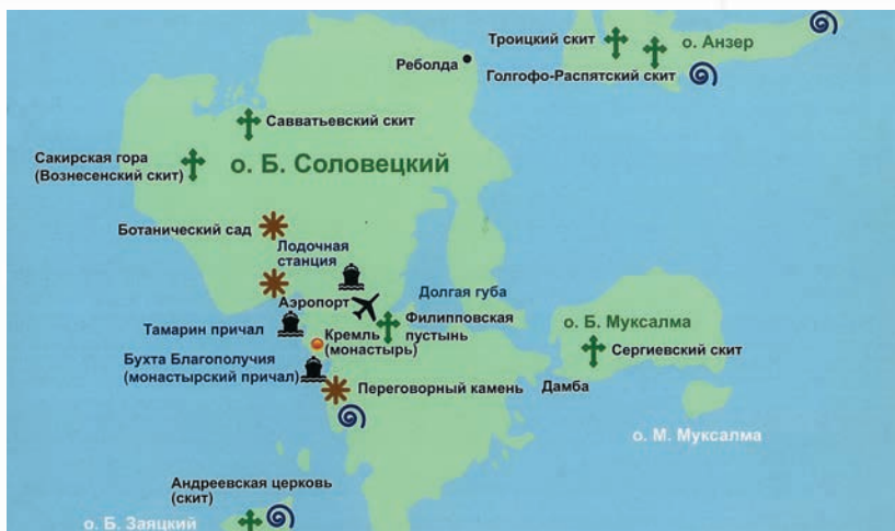
Остров Большой Соловецкий

и рыбьим жиром в качестве горючего. Позднее поставили движок и провели электричество. Через несколько месяцев учебы выявилась недостаточная обеспеченность школы в Савватьево в хозяйственном отношении, и часть юнг была передислоцирована в кремль монастыря, в результате чего школа территориально разделилась на две части.