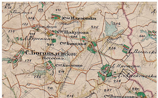
Схема местности на месте бывшего сельца Концово