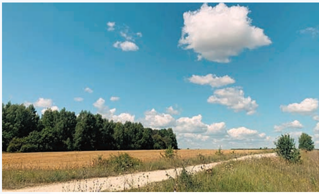
Дорога между полей от Богоявленской церкви на деревню Протуры и р. Тростники

притоков небольшой речки. На карте речка называется Тенканта, в списке населенных мест Тамбовской губернии за 1862 г. она названа – Тенконта. На некоторых картах встречается название Теньтевка – теперь это название другой реки, в которую впадает наша речка. На современных картах фигурирует название Тростники.