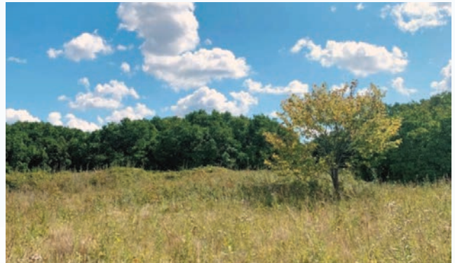
Старые, давно разросшиеся вширь посадки сирени по краям поляны