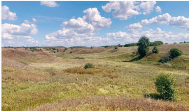
Заливной луг р. Тростники, справа за высоким деревом – группа кустарников. Здесь располагался господский дом в сельце Концово

Характерным ориентиром на местности является проходящая невдалеке (несколько сот метров) высоковольтная ЛЭП.