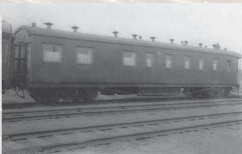
Вагон специального назначения до сих пор стоит на запасном пути