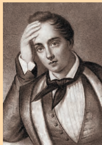
Е. А. Баратынский