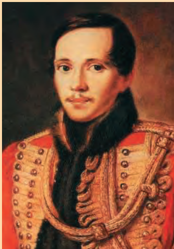
М. Ю. Лермонтов