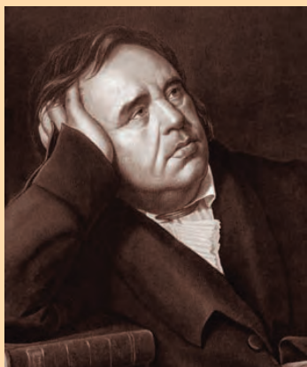
И. А. Крылов