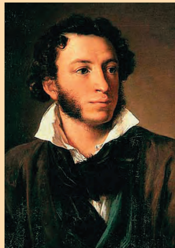
А. С. Пушкин

При первом же взгляде на таблицу видна зияющая дыра, лакуна. До начала тридцатых годов «природа-мать» регулярно дарила русской земле выдающихся поэтов и писателей. Но на протяжении четверти века, с 1831 г. (год рождения Лескова) до 1860 г.