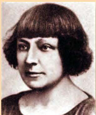
М. И. Цветаева

ымает искусство настолько, что после него, кажется, настанет пустота: