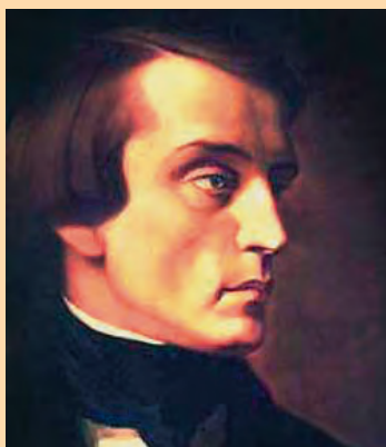
В. Г. Белинский

Козьма Прутков глубокомысленно изрек, что «время подобно искусному правителю, непрестанно производящему новые таланты взамен исчезнувших». Давайте проверим это утверждение и рассмотрим последовательность появления на свет русских поэтических гениев, родившихся в последней трети XVIII — конце XIX веков — период в 125 лет. Прежде всего хочу заметить, что все, о чем вы прочитаете в дальнейшем, дискуссионно и не претендует на абсолют. Как известно, к концу XVIII века во многом в результате деятельности Н. М. Карамзина (1766–1826) сложилась русская литература и ее читатели. Белинский писал: «Карамзин первый на Руси заменил мертвый язык книги живым языком общества. До Карамзина у нас на Руси думали, что книги пишутся и читаются для одних «ученых» и что неученому почти так же не престоало брать в руки книгу, как профессору танцевать. Оттого содержание книг, по тогдашнему мнению, должно быть как можно более важным и дельным, то есть как можно более тяжелым и скучным, сухим и мертвым... Карамзин умел заохотить русскую публику к чтению русских книг».