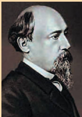
Н. А. Некрасов