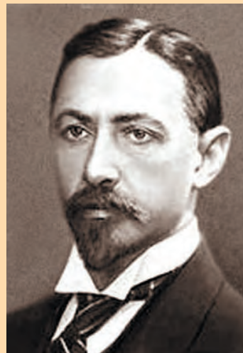
И. А. Бунин

Разберем две возможные ограничительные причины. Первая — это ослепительный свет, испускаемый гениями, и их взаимное отталкивание. Поколение, родившееся в 30–50-е гг., вступало в жизнь в середине 50–70-х гг. А это был период расцвета творчества той плеяды гениев, которые родились в 10–20-е гг. XIX века. В прозе это Тургенев, Достоевский, Толстой, в поэзии — Ф. Тютчев, А. К. Толстой, А. Фет, Н. Некрасов. Нужно было иметь дерзновенную веру в свои силы, чтобы преодолеть свет, испускаемый моцартами литературы. Ведь даже зрелый мастер, зрелый талант при вспышке гения меркнет, и у него пропадает желание творить (тема терзаний Сальери). Гений под-