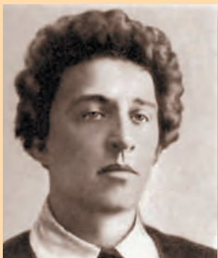
А. А. Блок