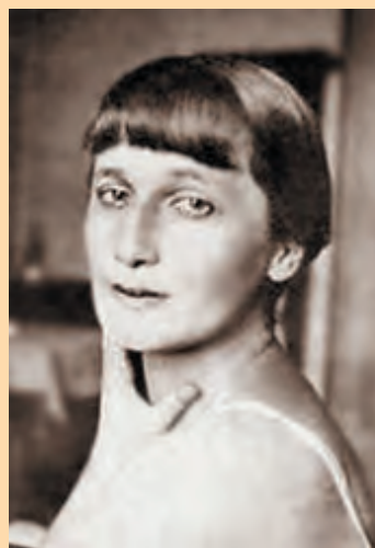
А. А. Ахматова