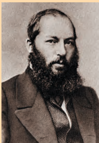
А. А. Фет

(год рождения Чехова) не родилось ни одного выдающегося писателя. А с поэтами еще хуже. На протяжении полувека с 1817 г. (когда родились Толстой, Фет, Некрасов) по 1870–1880 гг. (когда родились Бунин и Блок) русская земля не посылала миру поэтических гениев.