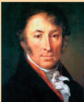
Н. М. Карамзин