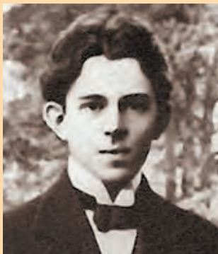
О. Э. Мандельштам