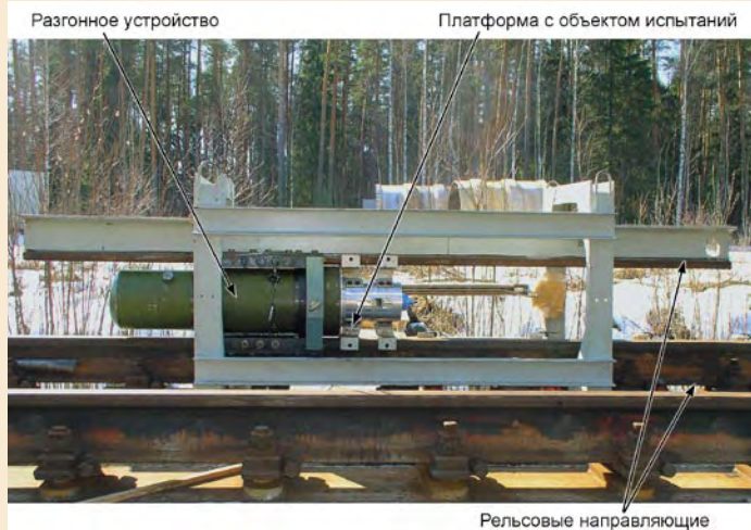
Стенд для испытания приборов на воздействие импульсных линейных ускорений

рядов. Большая длительность ударных волн при малых габаритах установки достигнута с помощью специального выхлопного устройства, которое компенсирует влияние окружающей атмосферы, а волновод трубы ведет себя подобно бесконечной трубе. Ударная волна создается при помощи двух вскрываемых пленочных мембран и поршня, движущегося по заданному закону под действием упругого амортизатора.