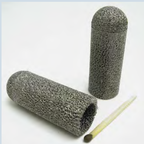
Детали и элементы из проволочного пресс-материала