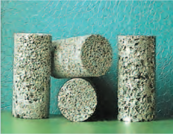
Изделия из пенометалла