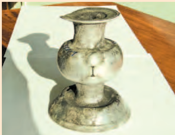
Мишень, обжатая лайнером (RD-7)