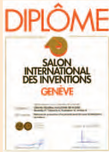
Диплом 37-го Международного салона изобретений, новых технологий и продукции «Женева-2009»