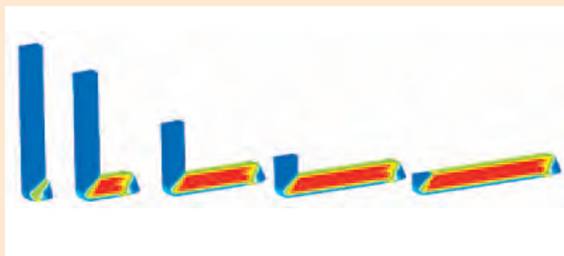
Компьютерное моделирование процесса РКУП